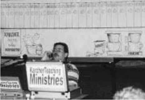
Foto: Ein Sketch darf natürlich bei einer solchen Feier nicht fehlen!