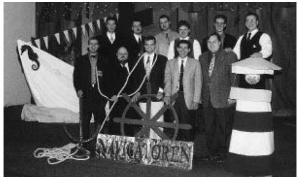
Foto: Diese Studienstufe hat sich den Namen „Navigatoren“ gegeben.