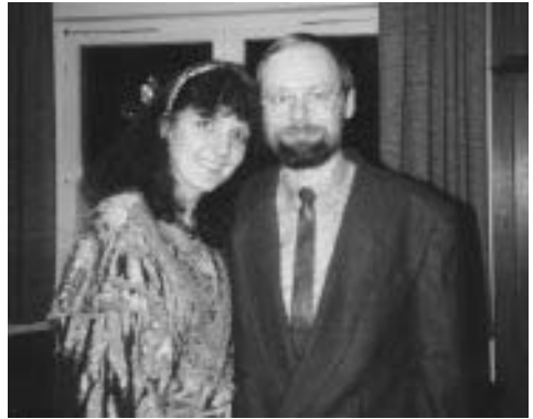
Der Autor und seine Frau:

Göttliche Liebe können wir nicht produzieren, sie ist ein Geschenk des Himmels. Aber wir können sie erstreben, denn sonst gäbe es diese Aufforderung nicht. In meiner Grundschulzeit haben wir solche Mitschüler als Streber bezeichnet, die fleißiger waren als andere, die noch