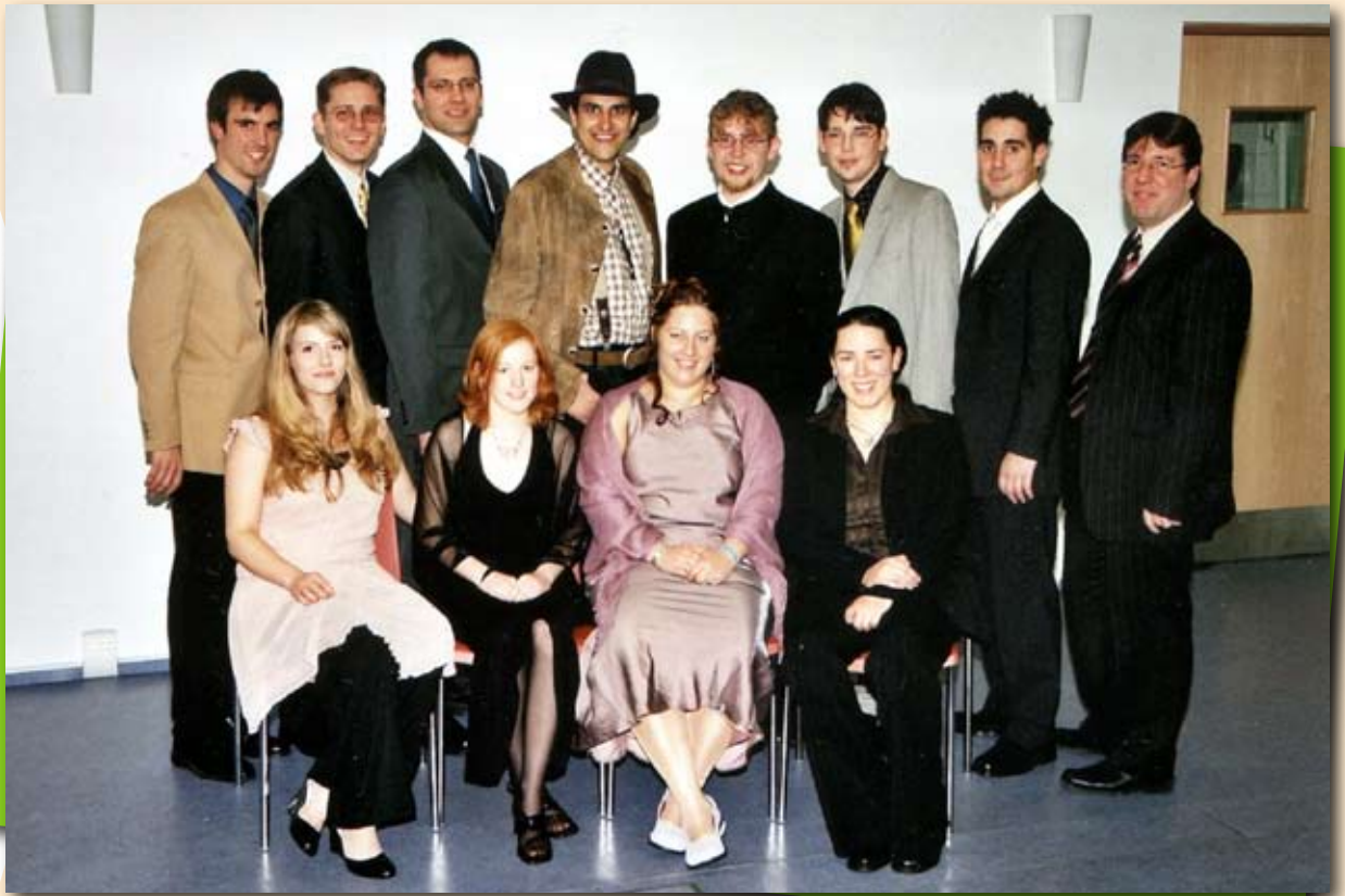
„Zwölf+“ von links nach rechts (in Klammern die Praktikumsgemeinde)